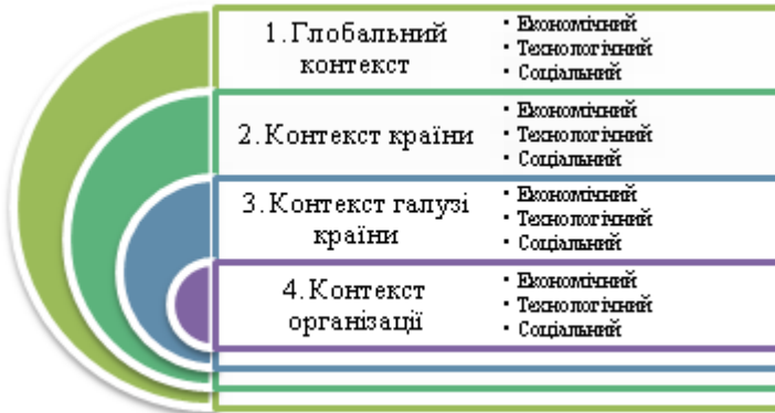
Рис. 3 – Концентрична модель рухомого контексту організації

Приклад моделі оцінки впливу оточення на проекти та програми розвитку фінансової установи наведено на рис. 4.