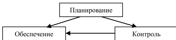
Рис. 1 – Схема процессов управления качеством проекта

При этом определение и анализ заинтересованных сторон проекта является входными данными процесса планирования качества и обуславливает наполнение связанных процессов.