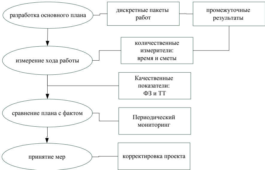
Рис. 1 – Основные этапы контроля хода выполнения проектных работ и соответствующие результаты

Измерение и оценка хода выполнения проекта делают необходимым процесс контроля, состоящий из четырех этапов (см. рис.1).