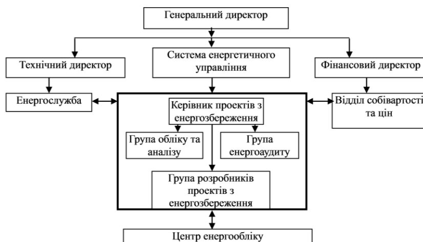
Рис. 1 – Структура управління енергоспоживанням

На першому етапі роботи групи енергетичного аудиту передбачається детальний аналіз енергетичного балансу (складання карти споживання енергії) підприємства, проведення розрахунків споживання енергії на одиницю виробленої продукції для окремого енергоємного устаткування та систем, або всього підприємства в залежності від задач, що поставлені перед відділом.