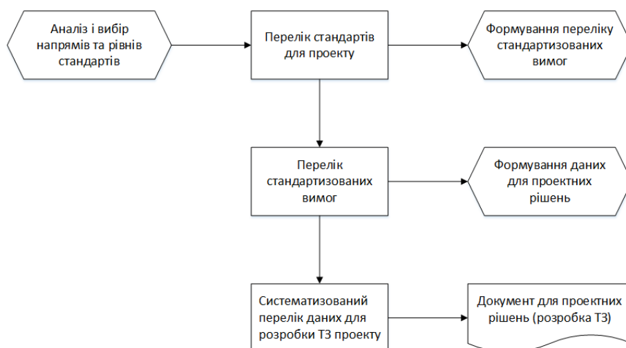
Рис. 3. Деталізація і послідовність дій при формуванні переліку стандартизованих вимог

Так, наприклад, для розробки програмного забезпечення базовими обрані стандарти CMM (Capability Maturity Model), ISO 12207, 15504, ITIL